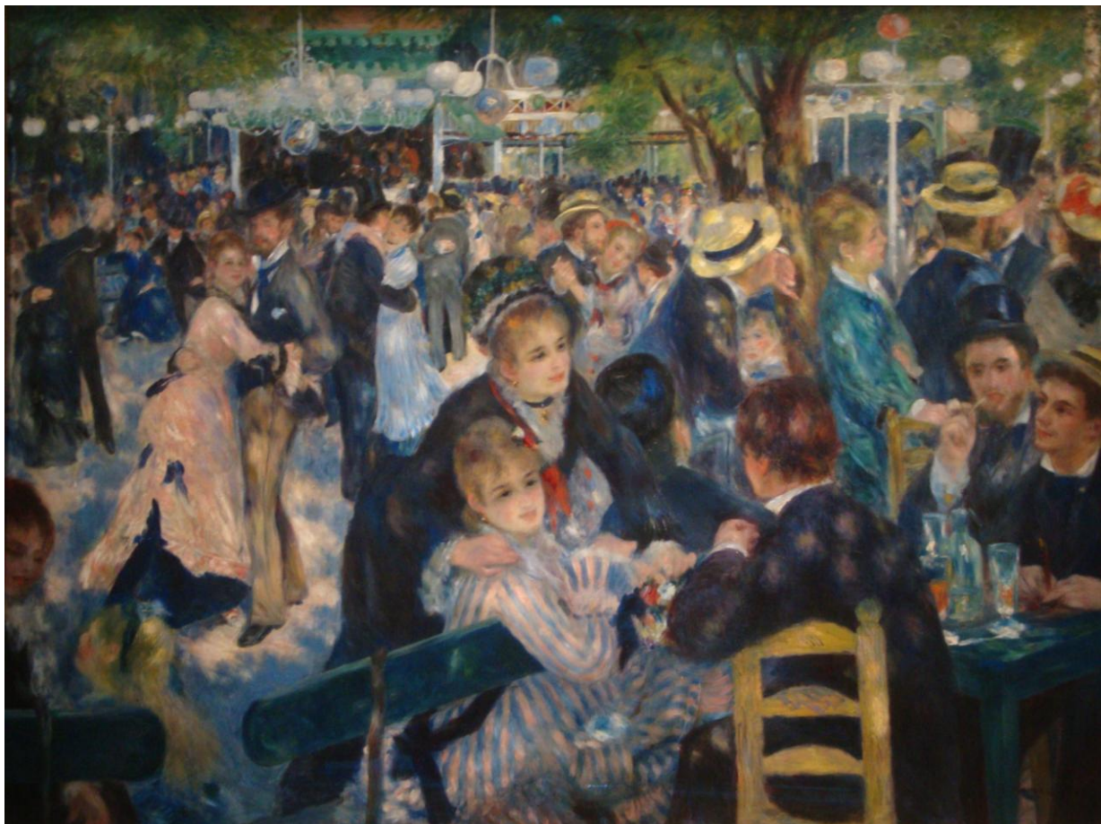
Bal du moulin de la Galette, Pierre-Auguste Renoir, musée d'Orsay