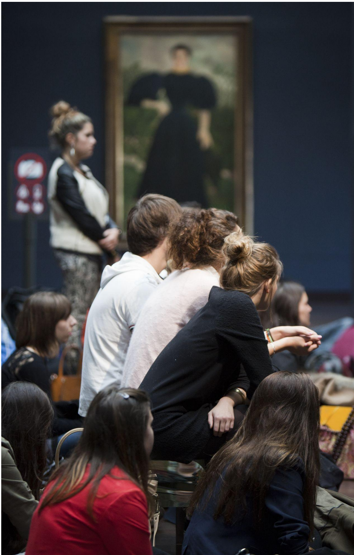
Conférence dans les salles impressionnistes du musée d'Orsay