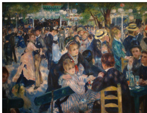
Pierre-Auguste Renoir, Bal au Moulin de la Galette , 1876

PLUS D'INFORMATIONS musee-orsay.fr / chatelet-theatre.com / zikphil.fr