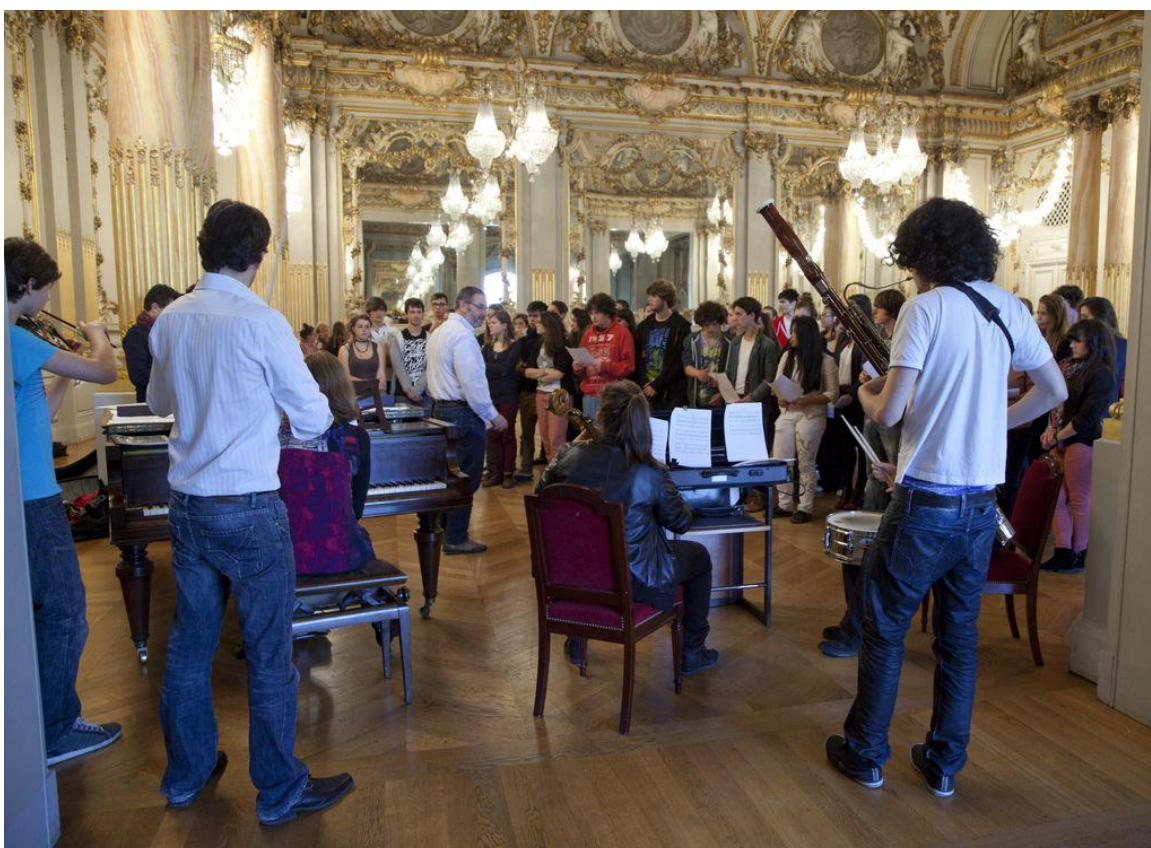
Première séance de travail, avec les trois classes participantes, salles des Fêtes du Musée d'Orsay